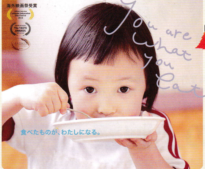
食べたものが、わたしになる。